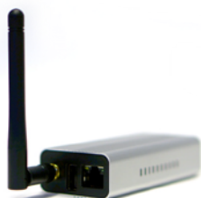
Navori Stix 3700